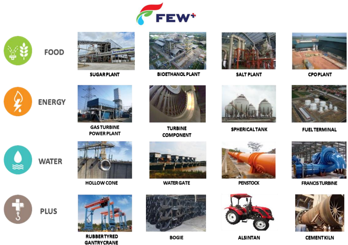
Gambar 1. Gambaran Pangsa Pasar Berdasarkan Filosofi FEW+