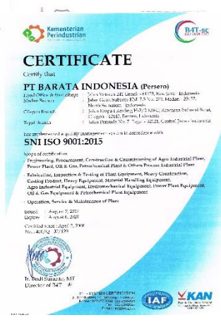
SNI ISO 9001:2015 ASME U Stamp