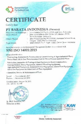
SNI ISO 14001:2015 ASME S Stamp