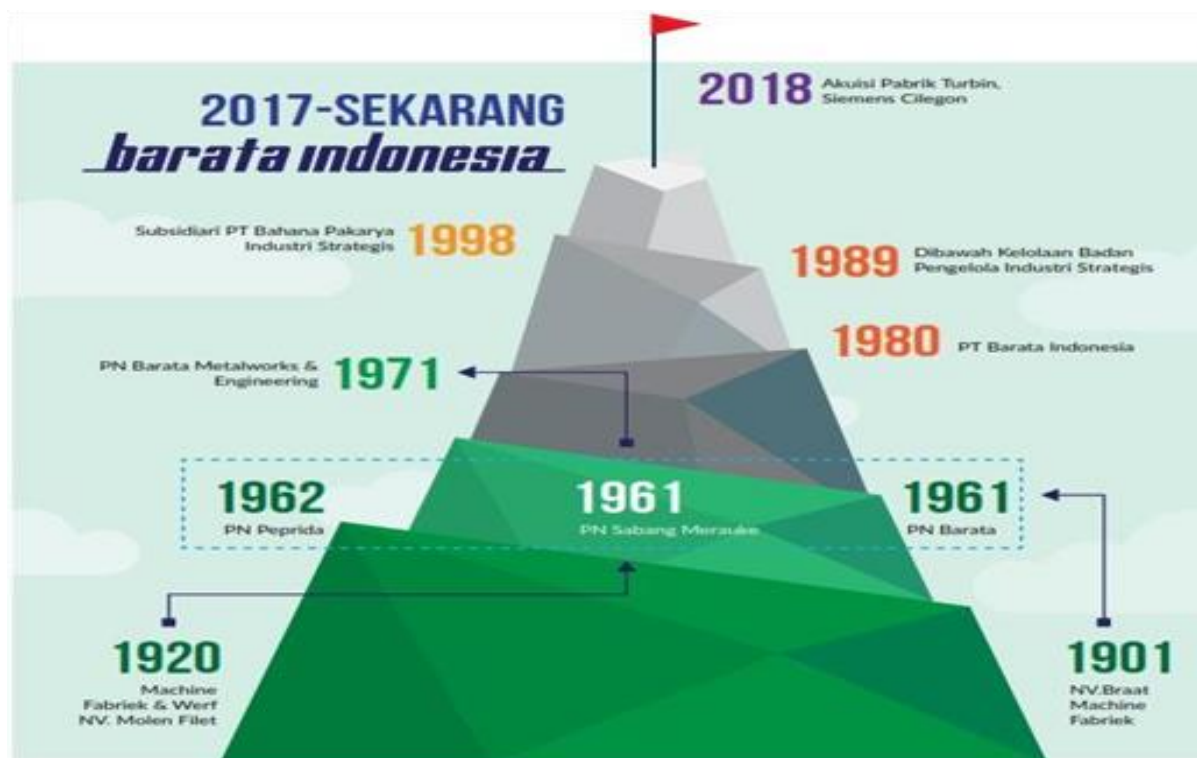
Gambar 1. Milestone Transformasi PT Barata Indonesia (Persero)

Milestone Transformasi PT Barata Indonesia (Persero) dijelaskan sebagai berikut :